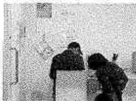
写真撮影、記事 byぼそこん倶楽部

機械が発達しても人は変わらないよ パソコンに新しい何かを発見して楽しさが伝わってきます 今日はきっとパソコンが打ちたくなるよ byニヒル